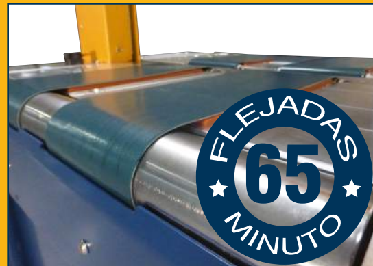
La máquina es capaz de realizar hasta 65 flejadas por minuto