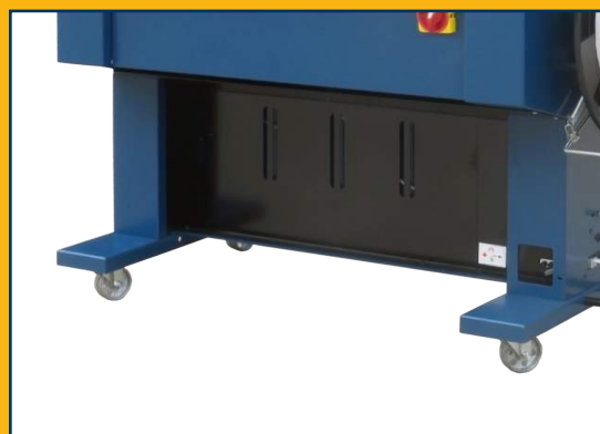
Equipada con ruedas para facilitar el transporte