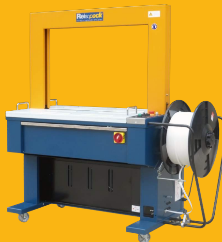
Flejadora con sistema de enhebrado automático y eyector de flejadas en vacío.