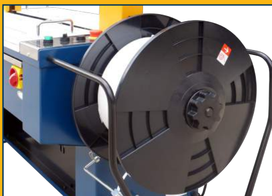
Bobina situada a la altura de la cintura y con sistema de cambio rápido